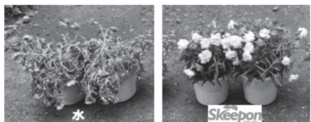
【図表2】「Skeepon」の効果の比較 (3週間水を与えず放置した場合)

な灌水量を低減させる点、③熱や塩にも強くする点です。 図表2に示すように、効果は一目瞭然です。「Skeepon」を与えたカーネーション(図表2右)は、三週間水を与えられなくても花が咲いた状態を維持しているのに対し、何も与えなかったカーネーション(図表2左)は、花が枯れ、茎も倒れてしまっています。 昔から農業現場では、防虫や